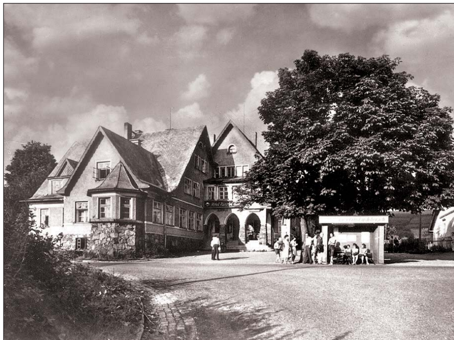
Průčelí Národního domu s návší, 60. léta