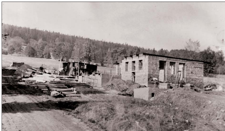
Zahájení výstavby lyžařského vleku VL 500 I. na Špičáku 1970.