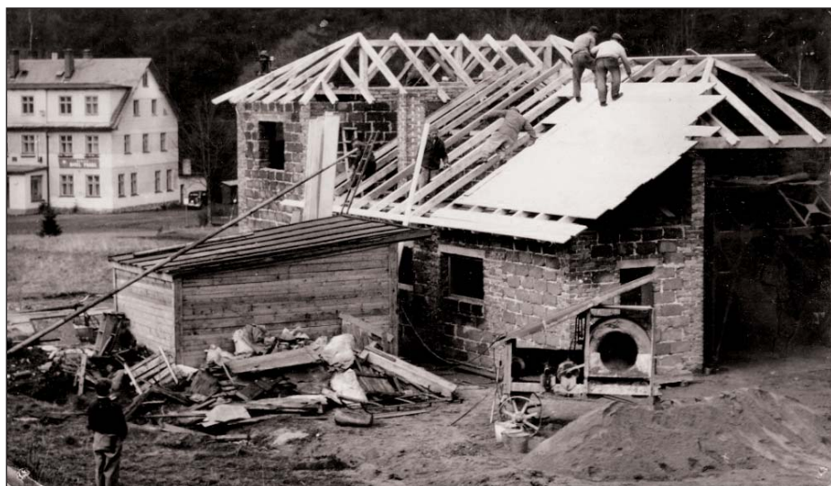
1957 – začíná výstavba lyžařského vleku před hotelem Praha, v roce 1960 byl uveden do provozu.