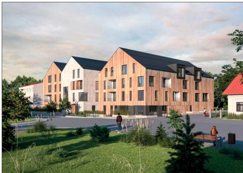
Nároží projektu s pohledem z návsi od kostela, restaurace v přízemním podlaží

však možnost spolupráce na venkovních prostranstvích, které spoluvytvářejí veřejný prostor. Upozornili však na dlouhodobě nejasnou představu obce o dalším využití návsi a tím pádem i komplikovanou spolupráci, kterou by zjednodušilo například pořízení architektonické studie centra obce, na kterou by pak investor mohl navázat a dál ji rozvíjet na svých pozemcích. Zapracováno bylo i odstoupené nároží (i když asi v polovičním rozsahu oproti současnosti), které část veřejného prostoru před stavbou ponechává. Dalším tématem diskuse bylo budoucí využití budovy. Obavy vzbuzuje především naproti ležící stavba apartmánového domu, která svým využitím centrum obce fakticky vytlidňuje. Nový dům bude podle majitele provozován jako apart hotel, jednotlivé bytové jednotky tedy budou využívány ke krátkodobému pronájmu, nikoliv k prodeji, což by mělo zajistit větší obratovost návštěvníků a tím i žádoucí pohyb v centru obce, který by mohl přispět i ke zvýšené poptávce po službách a tím postupně vést k většímu zabydlení návsi.