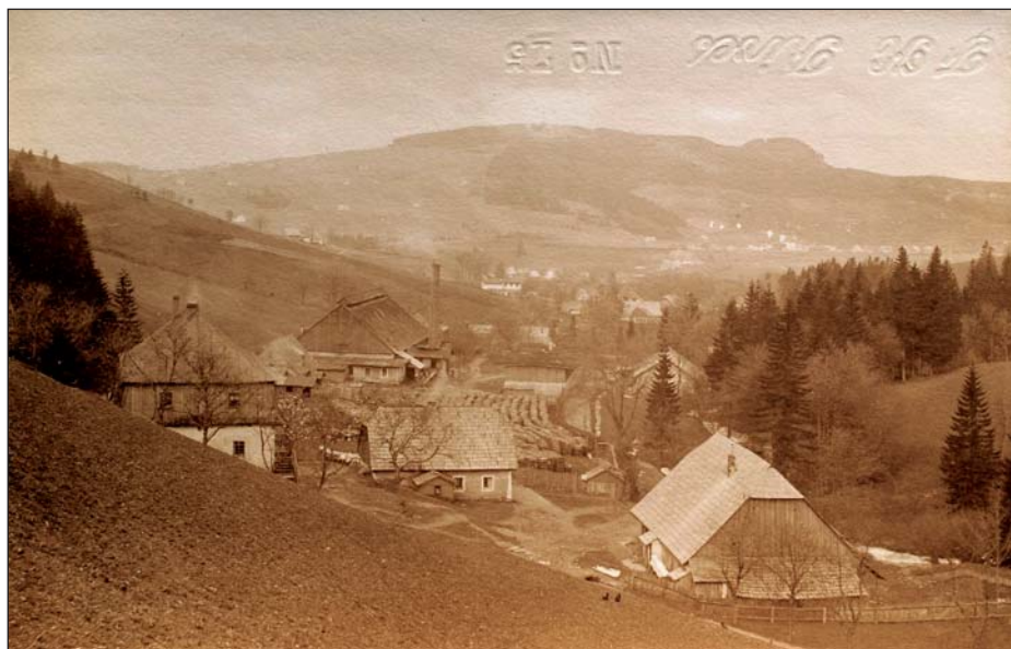
Pohled na sklárnu, vlevo v popředí budova školy.