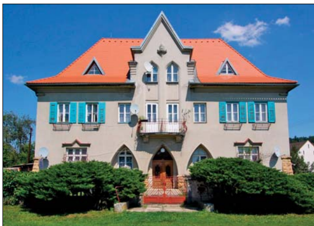
Srovnání se záložnou Oscara Czepy č. p. 225 v Taticích