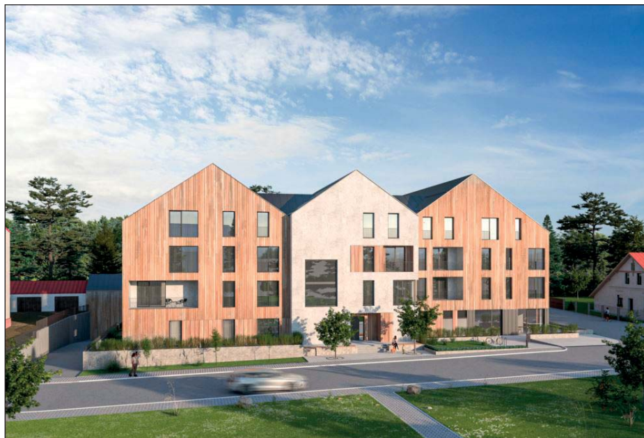
Průčelí navrhovaného projektu z pohledu od č. p. 1 přes silnici