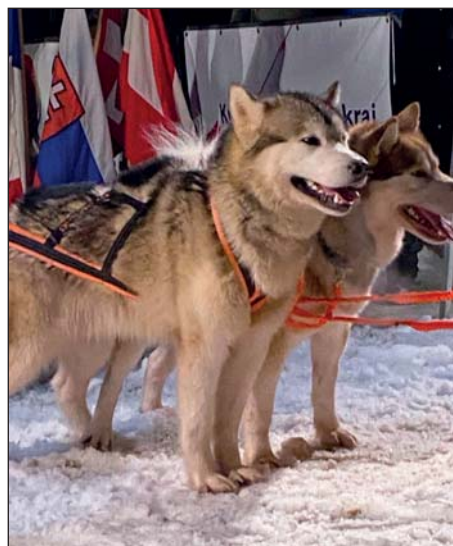
Aljašský malamut na startu Šediváčekova Longu 2024

■ Před několika lety hledala skupina nadšenců jezdících se psím spřežením v České republice oblast, která by byla svými sněhovými podmínkami, nadmořskou výškou, profilem trati i vstřícným postojem úřadů vhodná pro uspořádání závodu psích spřežení na dlouhé vzdálenosti. Ideální místo vyhovující v rámci možností všem podmínkám nalezla v Orlických horách, a tak byl pokusný nultý ročník (později přejmenován