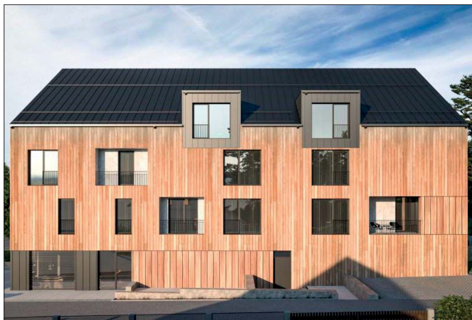
Projekt z bočního pohledu od č. p. 3, restaurace v přízemí vlevo