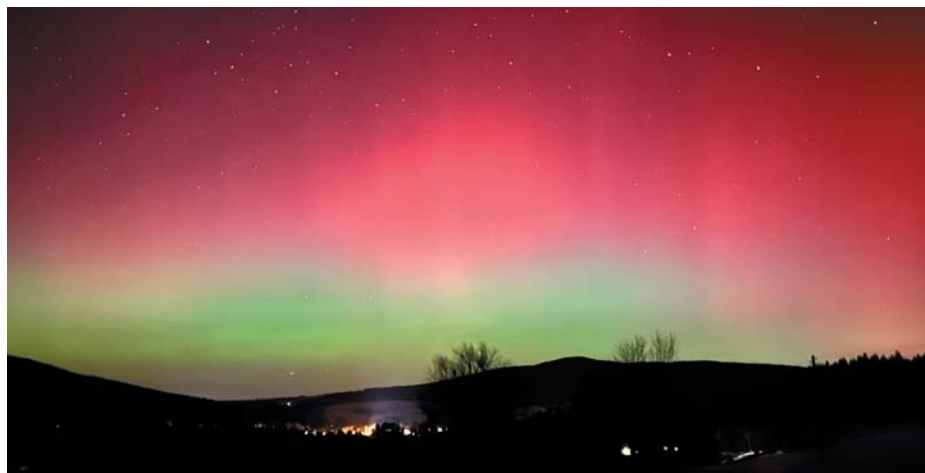
Polární záře U Matouše 19.1.2026.