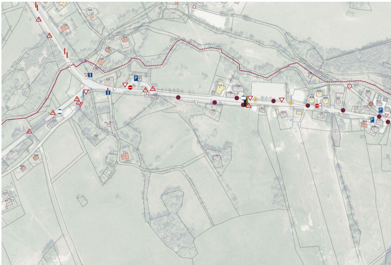
Obrázek č. 3.1.1: Ukázka mapy míst dopravního značení v posuzované obci

Měření dopravního značení probíhá pomocí geodetické GNSS. Každé místo je tak přesně umístěno do interaktivní mapy, v níž je možné si specifikata všech zařízení prohlédnout. U každého zaznamenaného bodu lze zjistit typ, účel značení, stav a polohu.