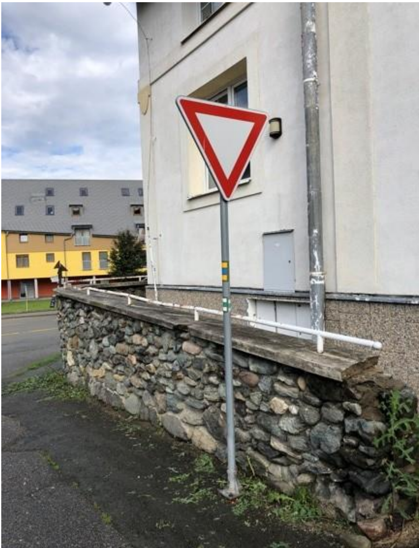
Foto 1: Stávající zařízení dopravního značení, ukazatel: Dej přednost v jízdě